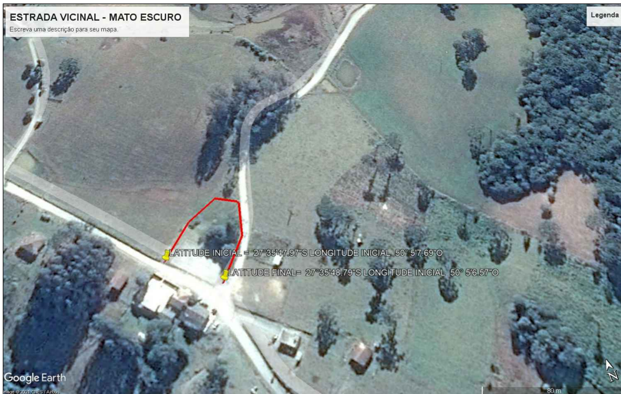
LOCAÇÃO DA RUA ESCALA 1:100