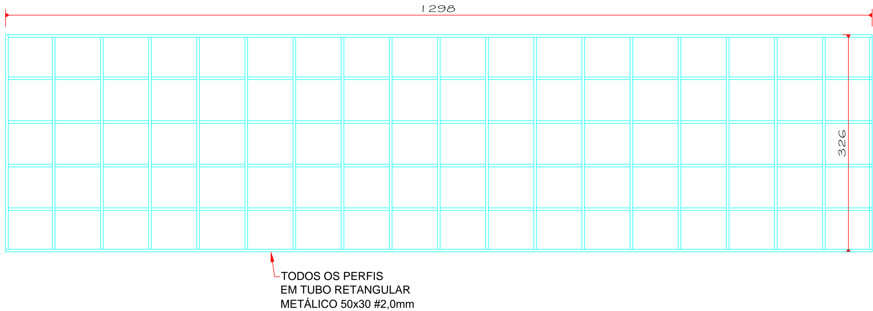
ESTRUTURA "C" Escala 1/50

NOTA: As 03 estruturas da fachada receberão placas em ACM